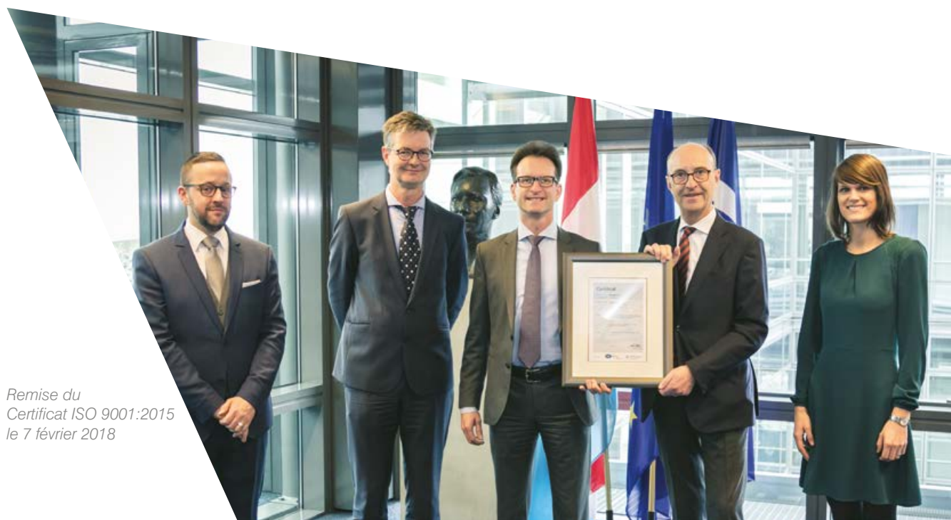
Remise du Certificat ISO 9001:2015 le 7 février 2018

Notre démarche d'amélioration continue intègre également notre engagement en faveur du développement durable. La Chambre de Commerce est détentrice du label «Entreprise Socialement Responsable» (ESR) octroyé par l'INDR.