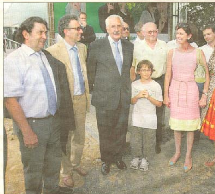
De nombreuses personnalités ont fait le déplacement à Esch