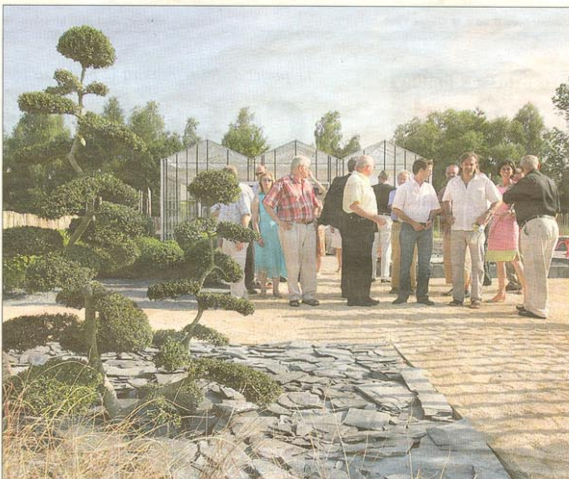
Le pavillon «Esch ville verte» illustre à merveille la cité du Sud en tant que ville où il fait bon vivre