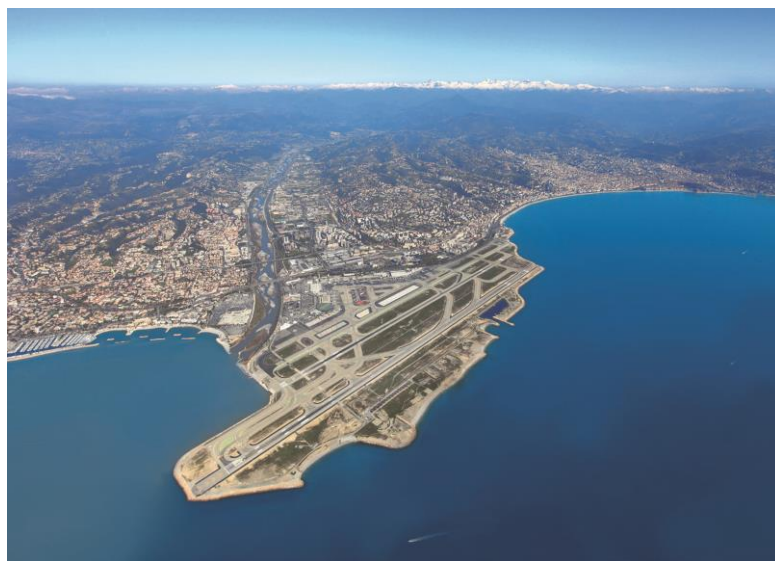
Aéroport de Nice Côte d'Azur (2ème aéroport international de France)

La Côte d'Azur est facilement accessible directement depuis l'aéroport Luxembourg-Findel avec la compagnie Luxair (1 vol direct par jour)