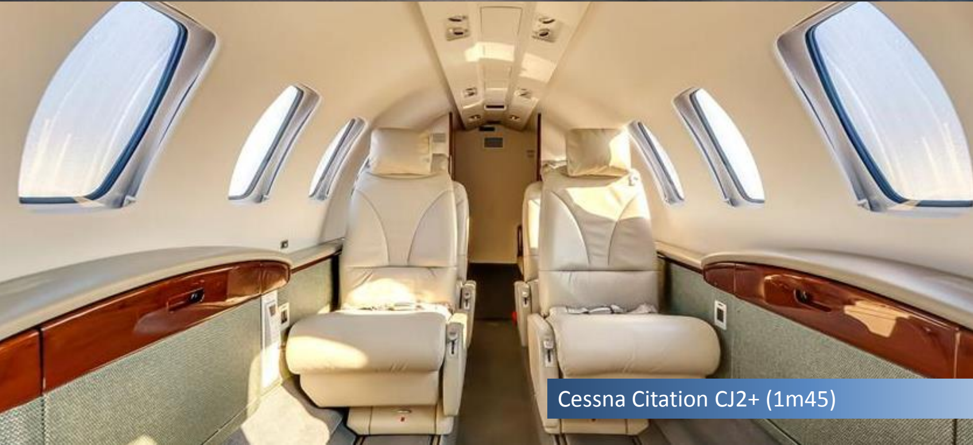
Cessna Citation CJ2+ (1m45)