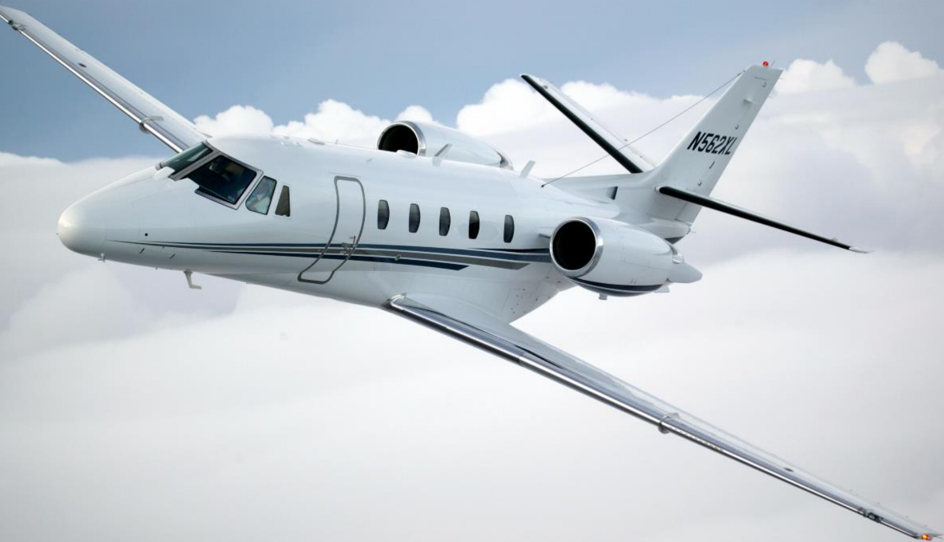
Cessna Citation XLS+ (1m73)