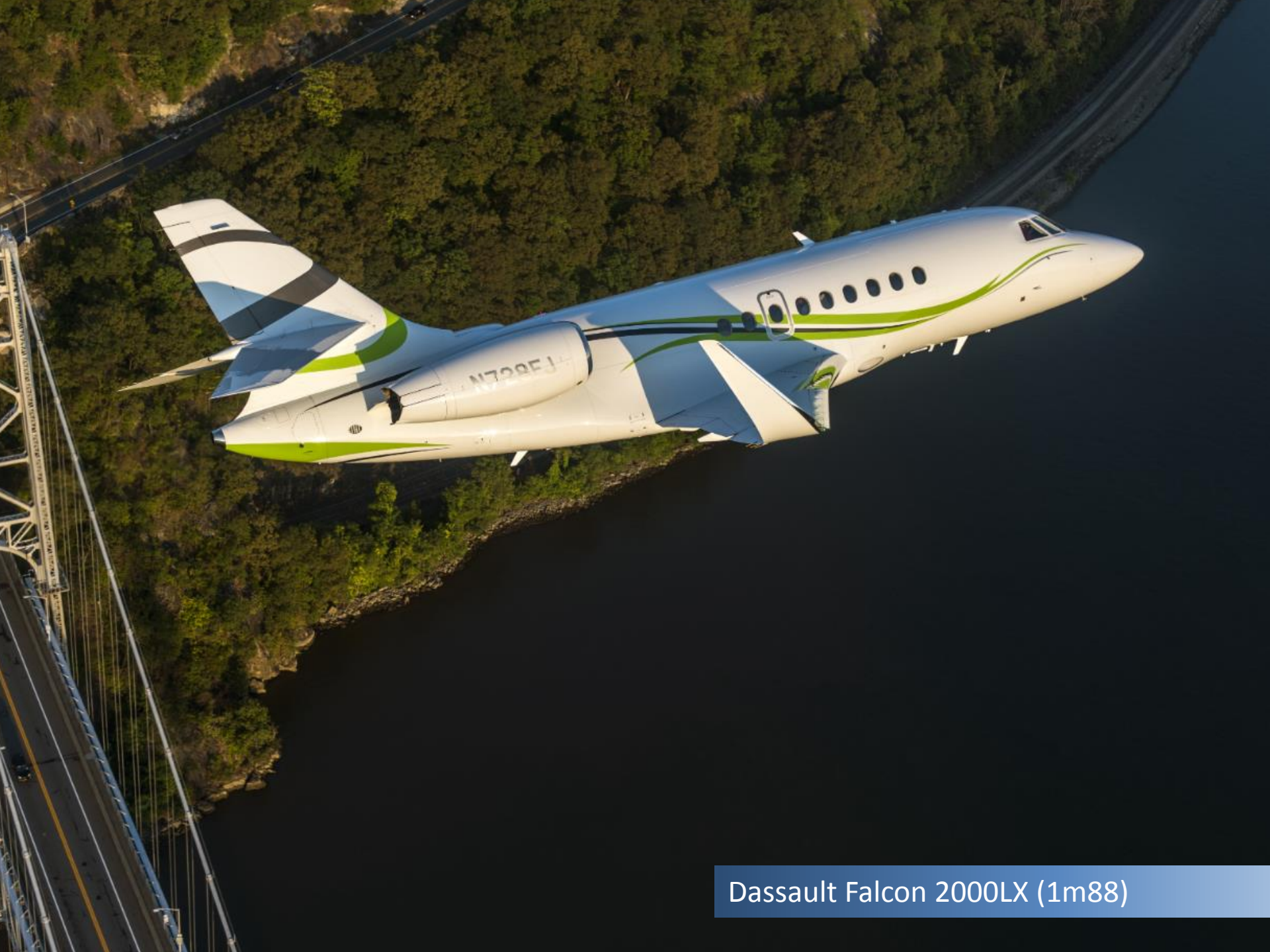
Dassault Falcon 2000LX (1m88)