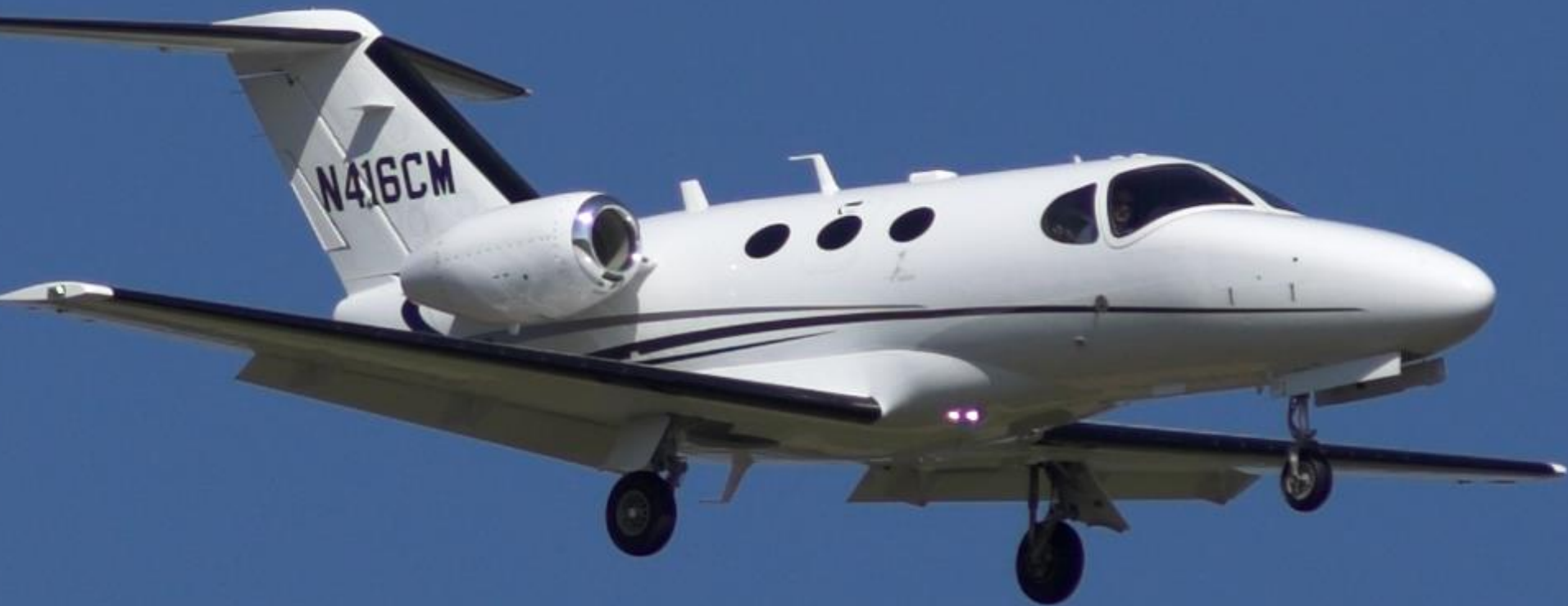
Cessna Citation Mustang (1m37)