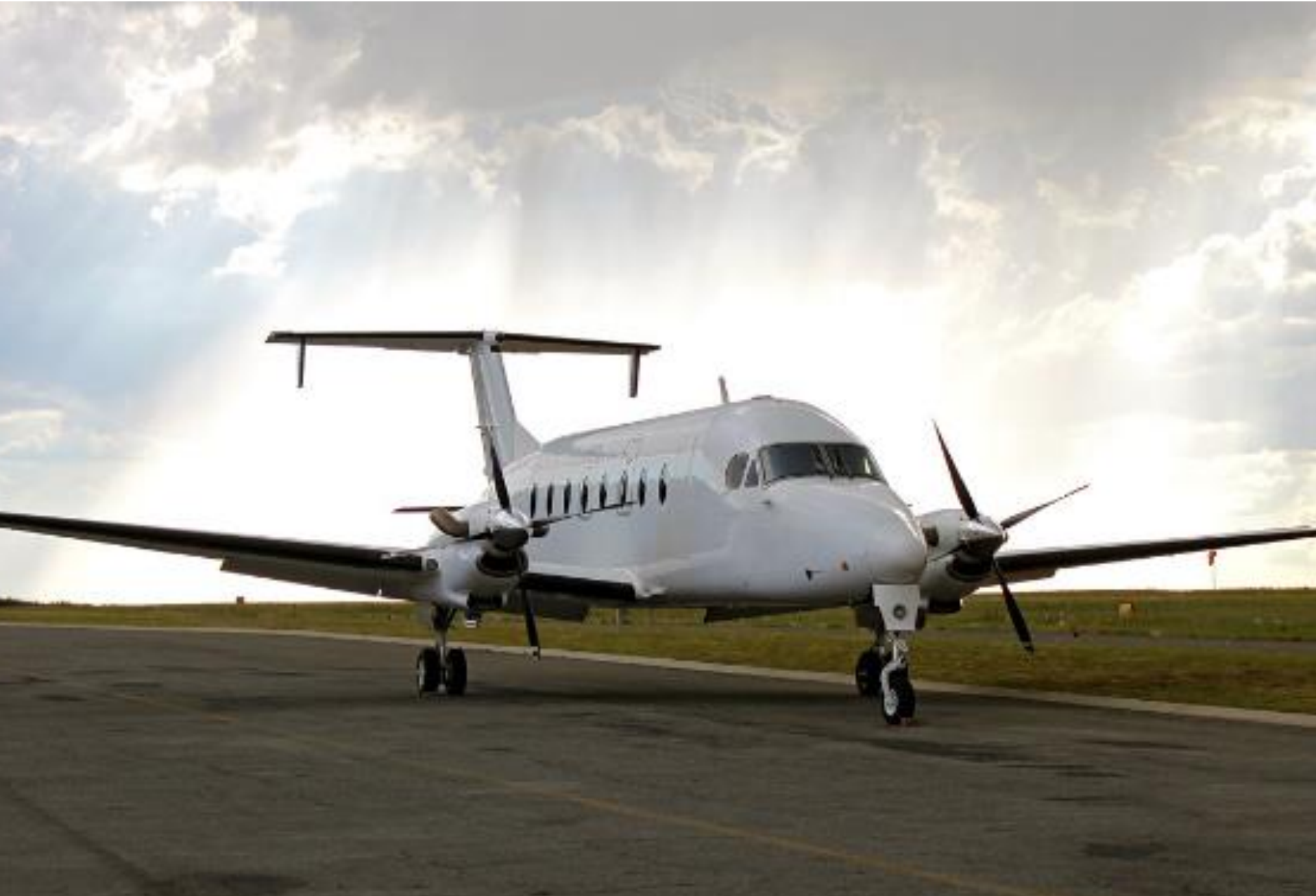
Beechcraft 1900D (1m78)